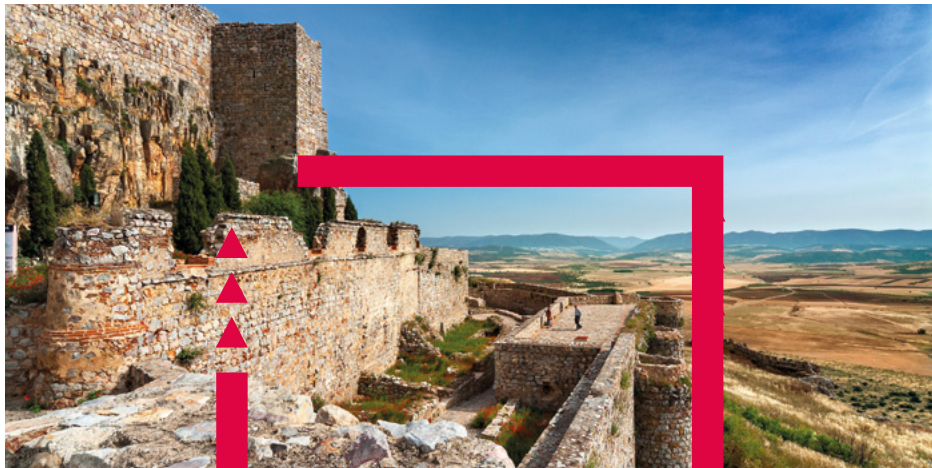
Castillo de Calatrava la Nueva, Ciudad Real.