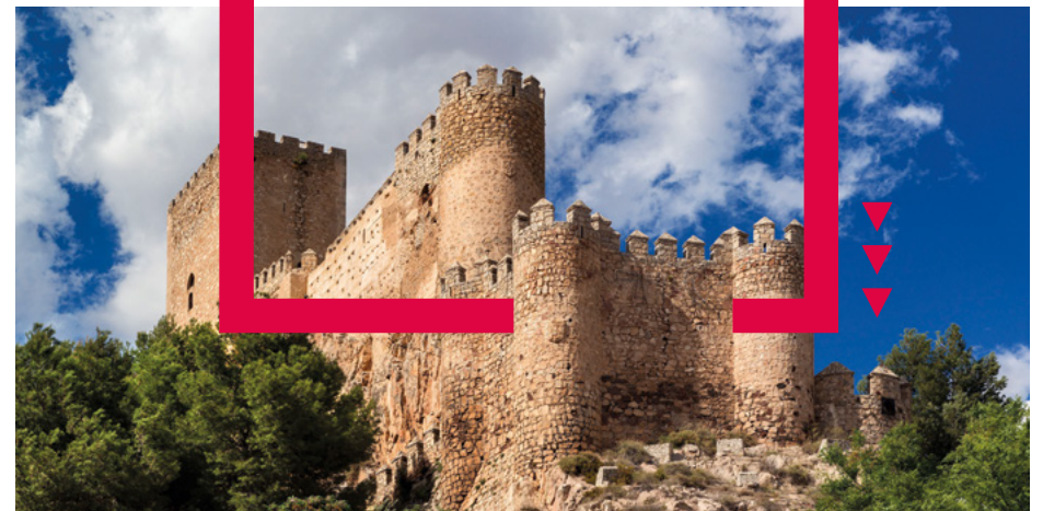
Castillo de Almansa, Almansa.