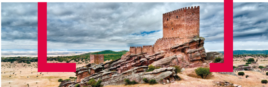
Fotografía: David Blázquez JCCM / Campillo de Dueñas