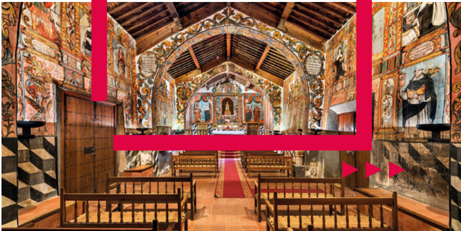
Ermita de Belén, Liétor.