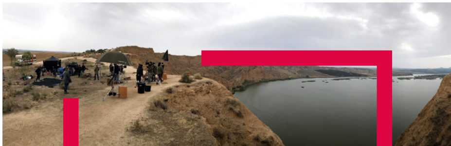
Fotografía: Mike Villanueva CLM*FC / Barrancas de Burujón, Toledo