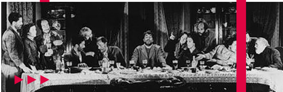
Viridiana, Luis Buñuel (1961)