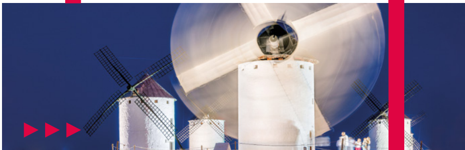
Fotografía: David Blázquez JCCM / Campo de Criptana

A través de la Castilla-La Mancha Film Commission, productoras y agencias de localización pueden encontrar los destinos que buscan para sus producciones. Un sinfín de emplazamientos que están esperando y que te sorprenderán.