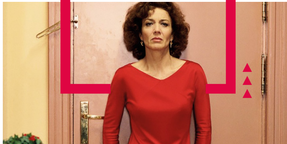
La flor de mi secreto, Pedro Almodóvar (1995)