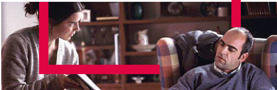
Te doy mis ojos, Icíar Bollaín (2003)

▲ ▲ ▲ Aventura, drama, romance, comedia... innumerables historias han visto como su trama se desarrollaba en Castilla-La Mancha, numerosos directores han hecho realidad sus ideas en esta tierra y cientos de actores han dado vida a personajes de ensueño en parajes idílicos e históricos. Castilla-La Mancha es un escenario natural que merece ser descubierto, filmado y visitado. Tres, dos uno... ¡acción! ▲ ▲ ▲