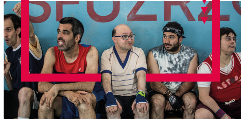
Campeones, Javier Fesser (2018)