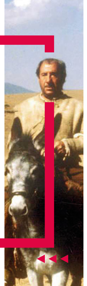
El Quijote, Manuel Gutiérrez Aragón, (1992)