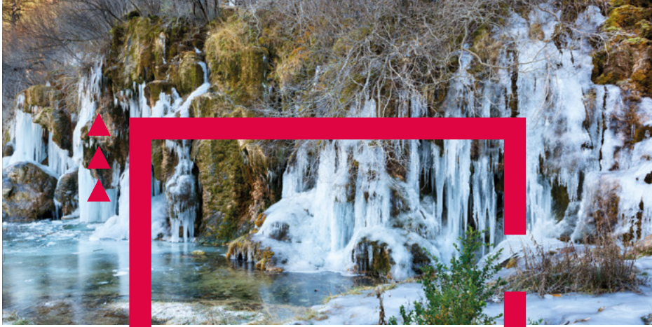
Río Cuervo, Cuenca.