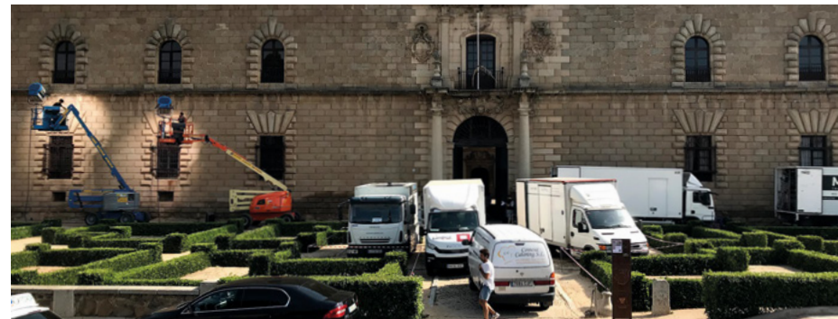
Fotografía: Mike Villanueva CLM*FC /Hospital de Tavera, Toledo.

Arquitectura popular, patrimonio religioso, destinos acogedores. Guadalajara recibe al visitante entre monumentos y naturaleza, envuelta en el sabor, en el sentir y en la historia. Una tierra que merece ser visitada con sosiego, calma y curiosidad. Guadalajara alberga entre sus joyas patrimoniales el Castillo de Zafra, presente en una de las mayores producciones de las últimas décadas: Juego de Tronos. Visítanos y sumérgete en el mundo de los siete reinos.